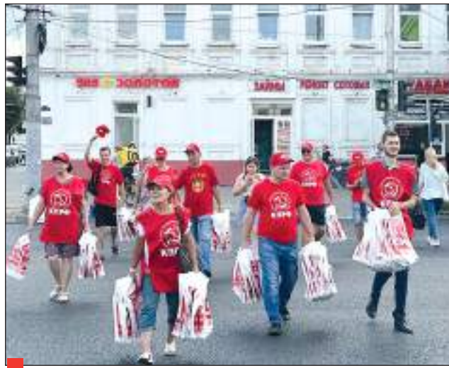
2023. В центре города Иваново коммунисты провели акцию «Красные в городе».