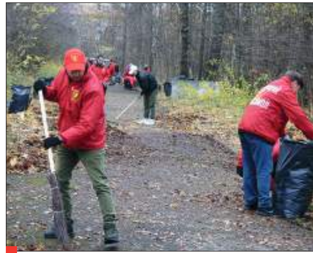
2024. Коммунисты проводят традиционный субботник на Мемориале старых большевиков в Иваново.

буллетень Ивановского обкома КПСС «Блокнот агитатора». Затем уже в наше время, до 2015 года Ивановский обком КПРФ выпускал «Политический собеседник».