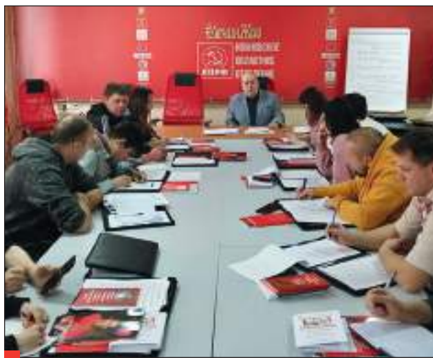
2021. Занятия четвертого потока Школы политической учебы при Ивановском обкоме КПРФ.

Бюро продолжало практику заслушивания отчётов Первых секретарей городских и районных Комитетов по одиннадцати критериям работы партийных отделений. Заслушано 32 отчёта, которые