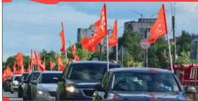
2020. Автопробег левопатриотических сил «За справедливую народную власть!» в городе Иваново.

Все зависит от продуманной, целенаправленной работы Бюро, Комитетов местных отделений и, в первую очередь, настойчивости секретарей партийных организаций.