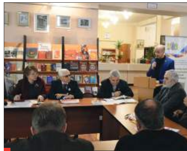
2022. Круглый стол в областной научной библиотеке к 100-летию СССР.

А 13 мая состоялся завершающий этап семинара-