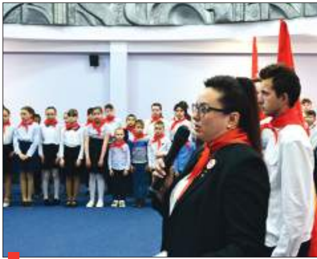
2022. В Ивановской области создана пионерская дружина «Алые паруса»