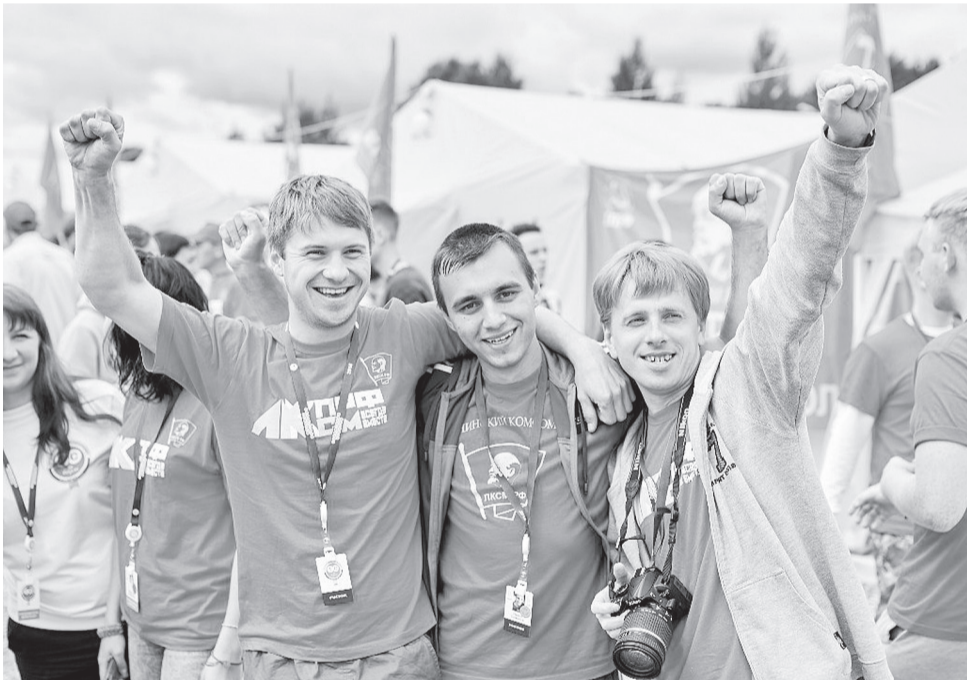
Ивановская делегация комсомольцев на «Территории смыслов» в 2016 году

Региональные комсомольские слёты уже прошли в Пермском крае, Оренбургской и Смоленской областях. Череду федеральных форумов откроет Урал, проведя в середине июля слёт в Свердловской области. В эти же дни пройдёт межрегиональный комсомольский автопробег «20:17. От Ульянова к Ленину» из Ульяновска в Самару.