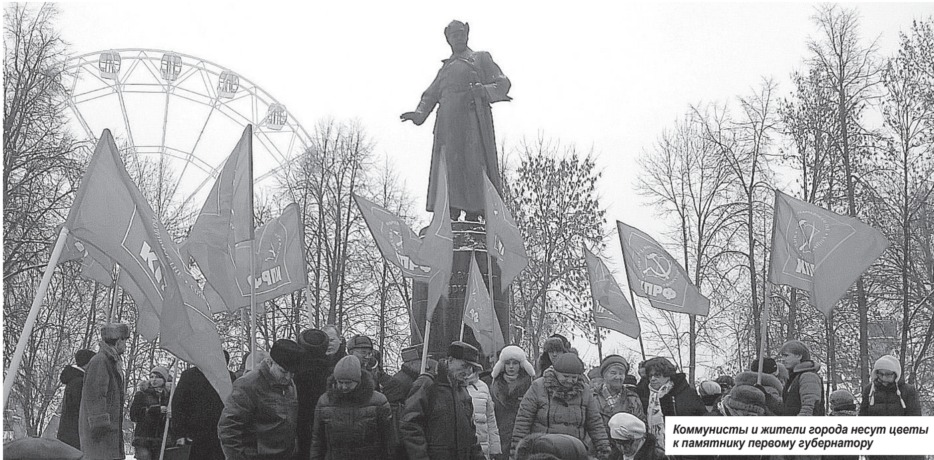
Коммунисты и жители города несут цветы к памятнику первому губернатору