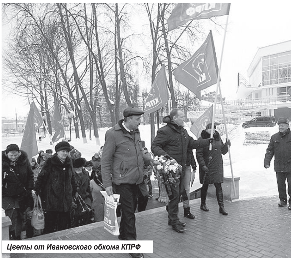
Цветы от Ивановского обкома КПРФ