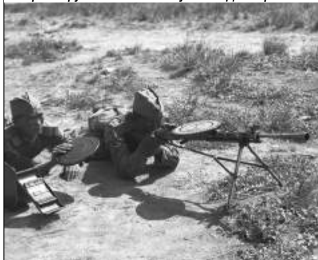
Ковров. Оружейный завод - пулемет Дегтярева