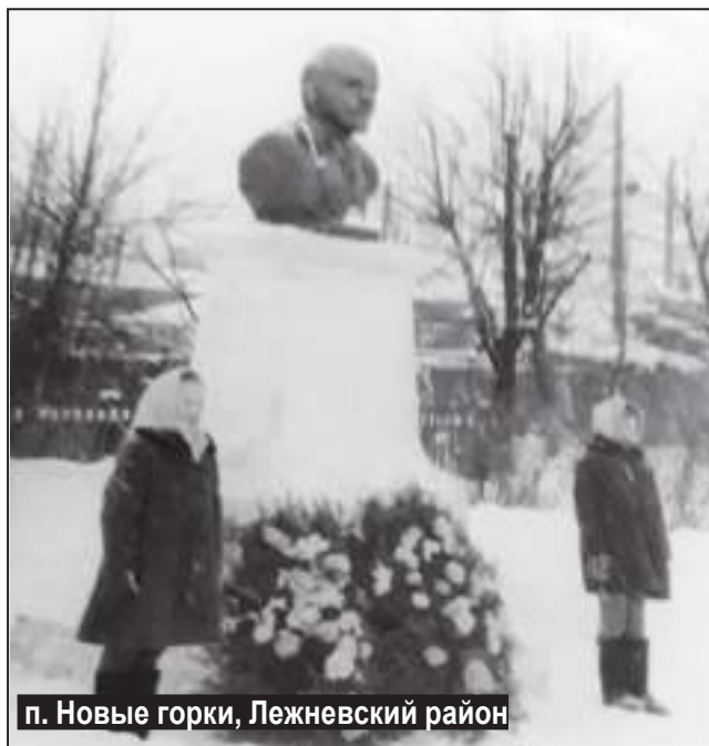
п. Новые горки, Лежневский район