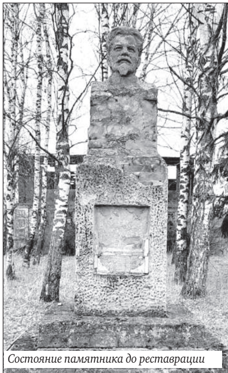
Состояние памятника до реставрации