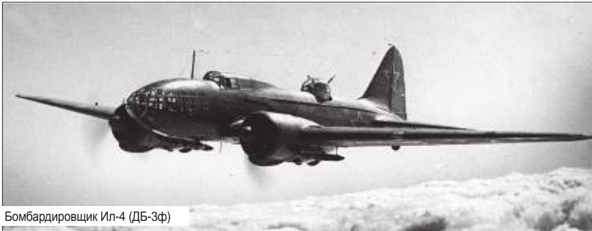
Бомбардировщик Ил-4 (ДБ-3Ф)

Сталин с восторгом одобрил дерзкий план морских лётчиков, и на следующий день, 27 июля отдал приказ: произвести бомбовый удар по Берлину и его военно-промышленным объектам.