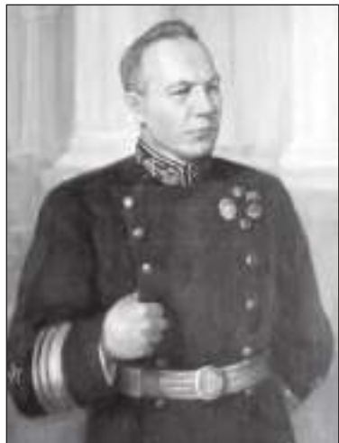
А.Ф. Жаворонков, 1941 г.