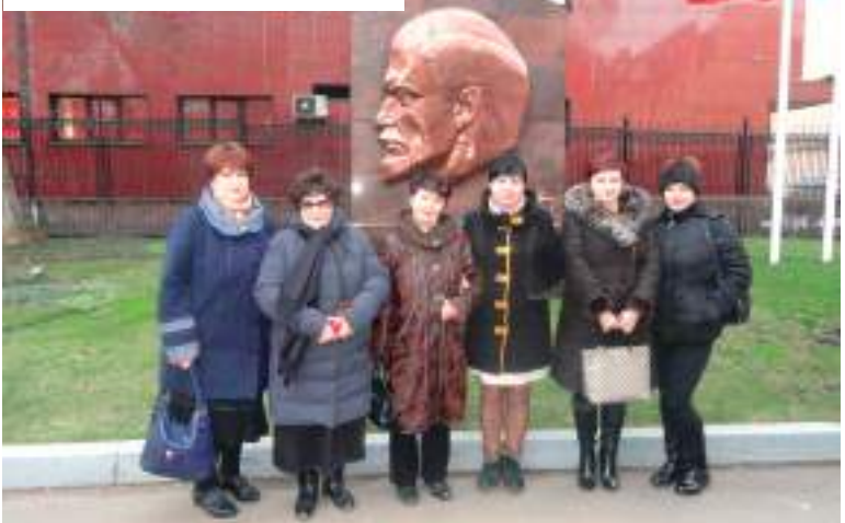
Делегация Ивановской области не съезде в Москве.