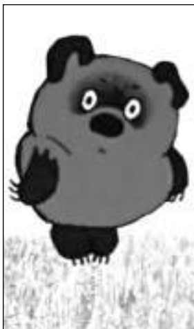
Робина и Винни-Пуха в зачарованном месте».

Прозаические книги составляют дилогию, и каждая из этих книг содержит 10 рассказов с собственными сюжетами — от первой, «в которой мы знакомимся с Винни-Пухом и несколькими пчёлами» и до двадцатой, «в которой мы оставляем Кристофера