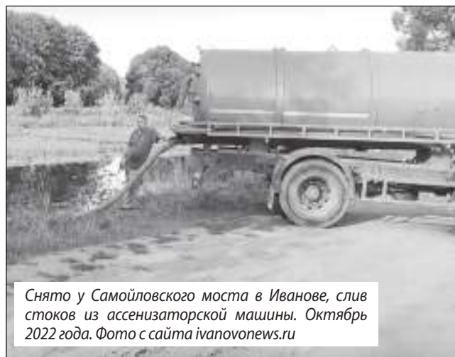
Снято у Самойловского моста в Иваново, слив стоков из ассенизаторской машины. Октябрь 2022 года.