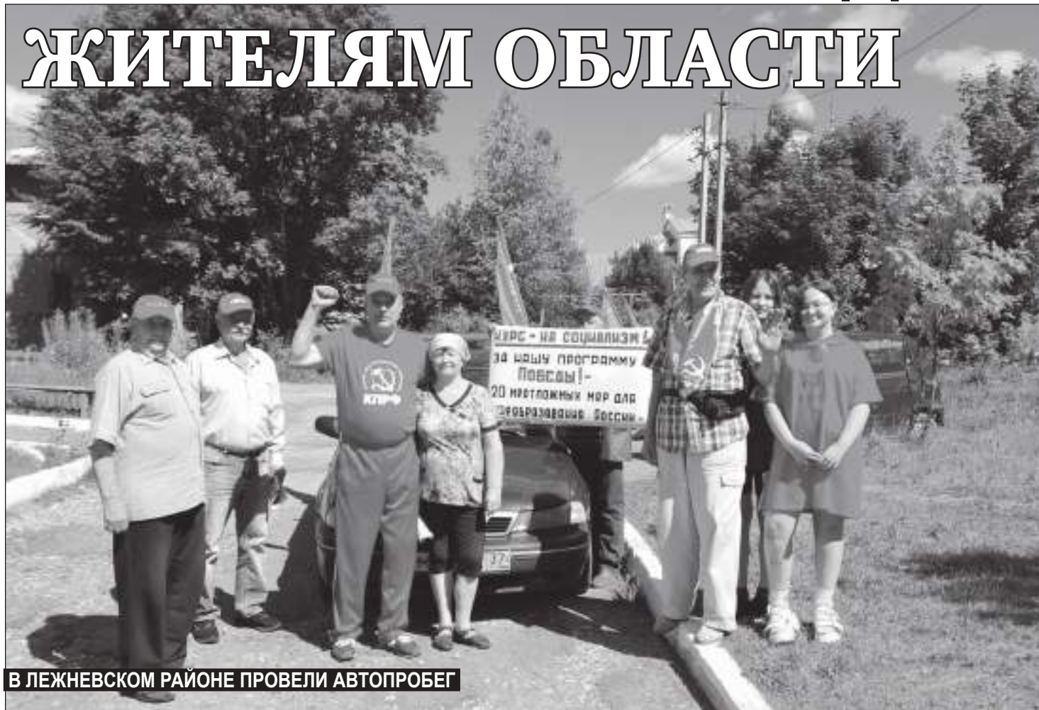
В ЛЕЖНЕВСКОМ РАЙОНЕ ПРОВЕЛИ АВТОПРОБЕГ

В последний месяц зимы мир изменился и уже никогда не вернётся в прежний ритм жизни. Безусловно, эти изменения коснулись и каждого гражданина нашей страны: рост безработицы, взвинчивание цен, обесценивание заработных плат трудящихся. В стране появилась социальная напряжённость, сопоставимая, наверное, с ситуацией в 90-х годах.