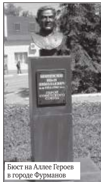
Бюст на Аллее Героев в городе Фурманов

13 сентября 1943 года в бою за село Крестище (Красноградский район Харьковской области) его танк возглавил атаку роты, вырвался вперед и снова был подожжен. Но и на горящем танке экипаж продолжал вести бой. Объятая пламенем машина ворвалась в боевые порядки гитлеровцев. Танкисты уничтожили три противотанковых орудия, самоходную пушку «фердинанд», три миномета и до тридцати вражеских солдат и офицеров. Лишь после того, как к захваченному рубежу подошли остальные танки роты, экипаж выбрался из горящей машины.