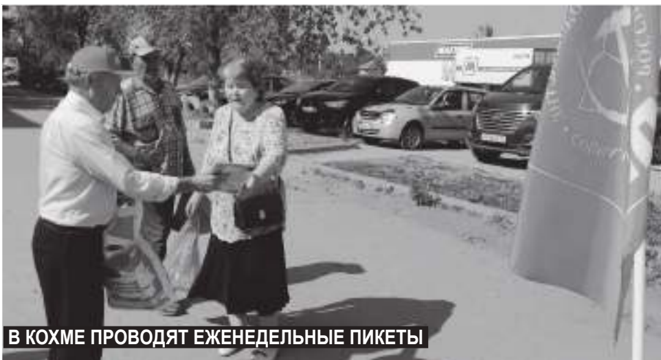
В КОХМЕ ПРОВОДЯТ ЕЖЕНЕДЕЛЬНЫЕ ПИКЕТЫ