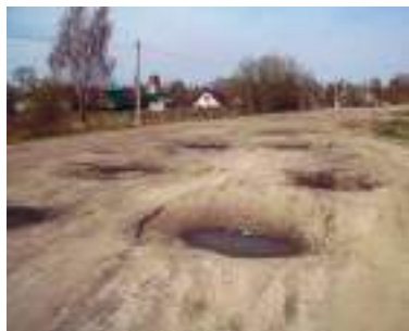
Разбитая дорога до села Марьинского