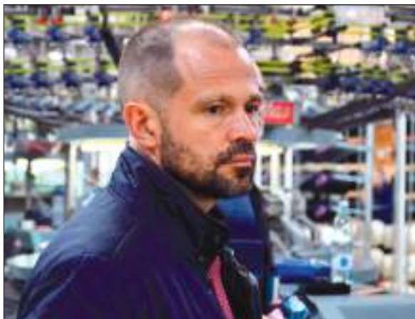
Роман ЛЯБИХОВ в ходе визита в Кинешму посетил текстильное производство

- И не только Ивановская. Вижу постоянно заголовки в СМИ: «Иваново вымирает», «Из Костромы уезжают», «Молодежь не желает оставаться в Ярославле» и т.д. Регионы вымирают и будут вымирать, если