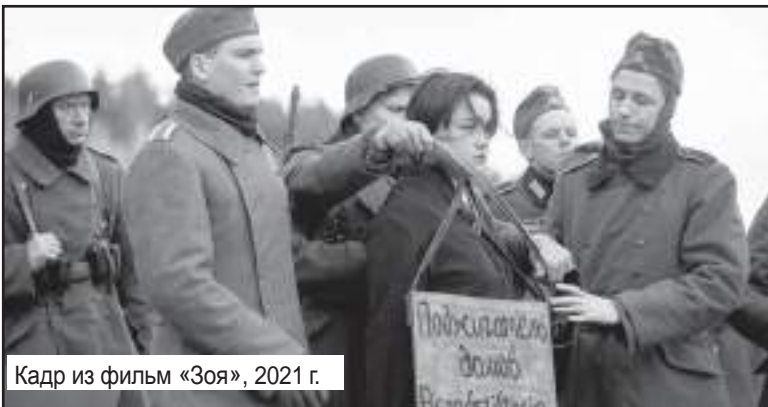
Кадр из фильм «Зоя», 2021 г.

В фильм притянут за уши образ Сталина. Вроде как авторы его не сильно осуждают за приказ «выгнать немцев на мороз», и ценят то, что он не уехал в Куйбышев, а остался в осажденной Москве. Кстати, принял он это решение якобы после того, как вспомнил слова Зои, когда встречался с будущими партизанами. А с другой стороны