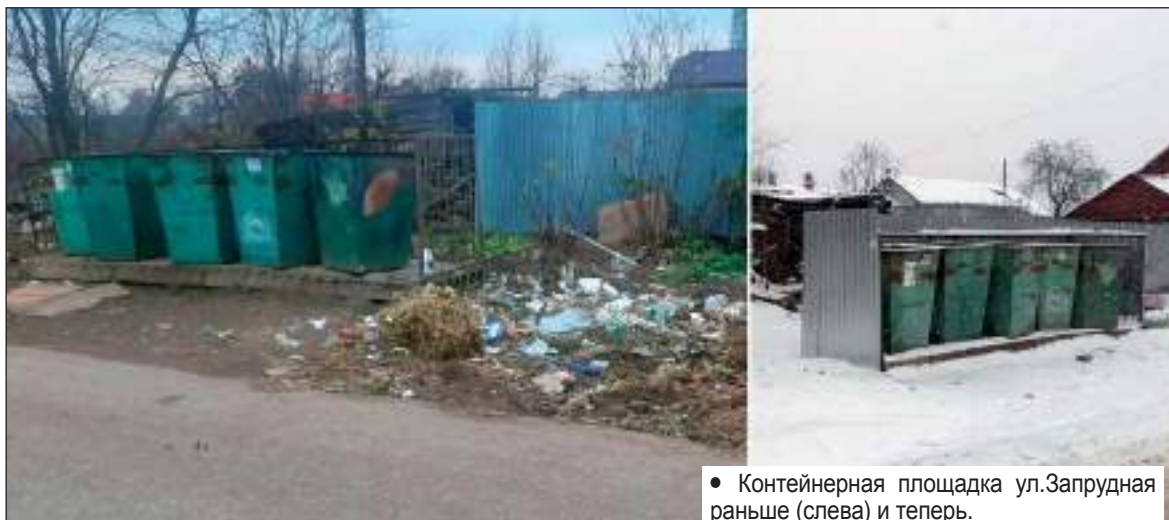
• Контейнерная площадка ул. Запрудная раньше (слева) и теперь.