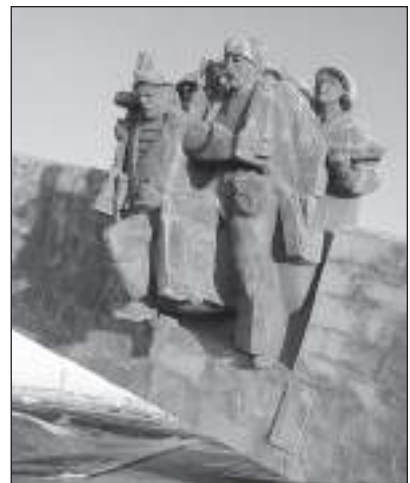
Памятник защитникам Малой земли