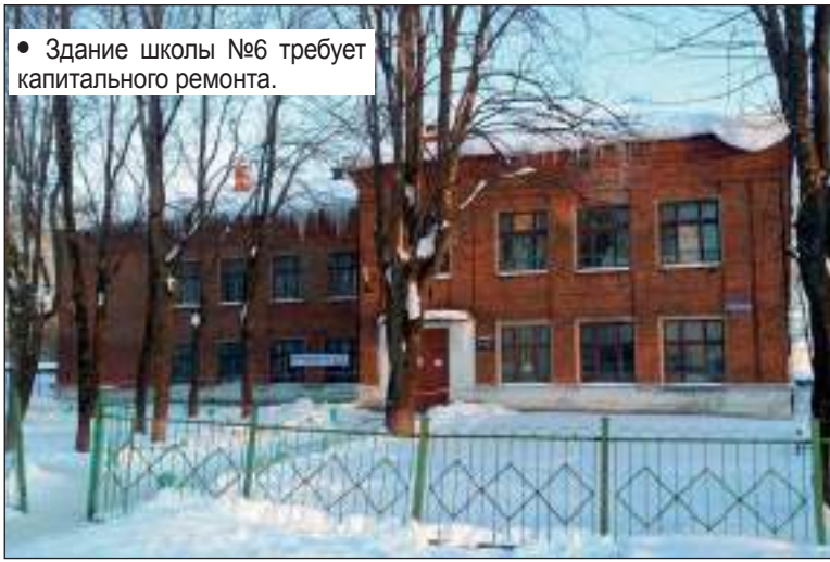
• Здание школы №6 требует капитального ремонта.