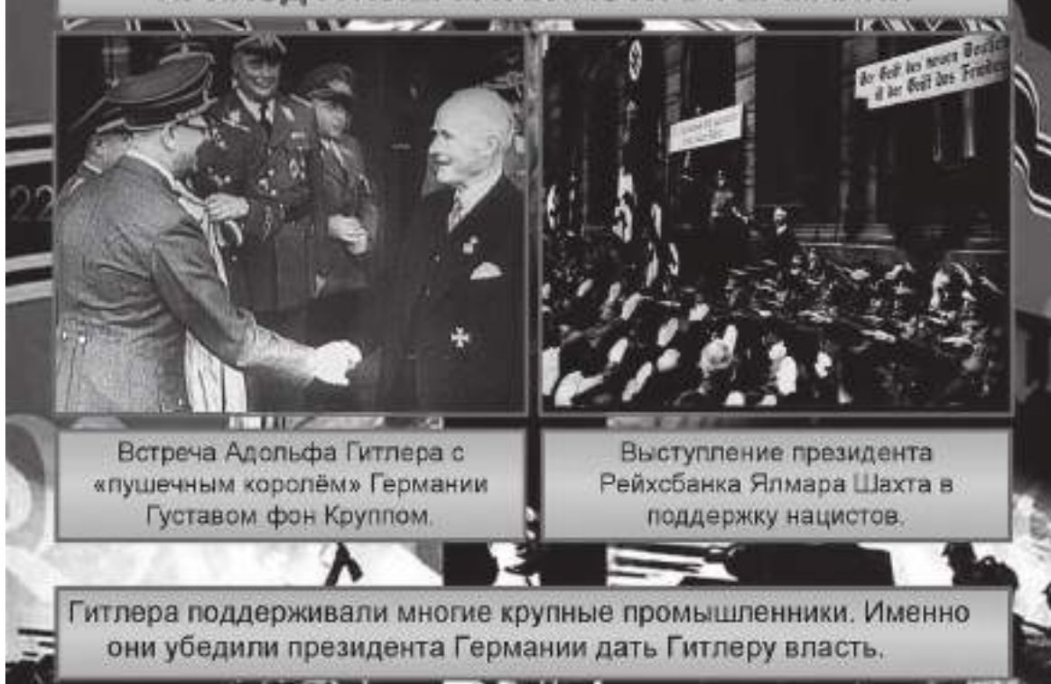
Встреча Адольфа Гитлера с «пушечным королём» Германии Густавом фон Круппом.