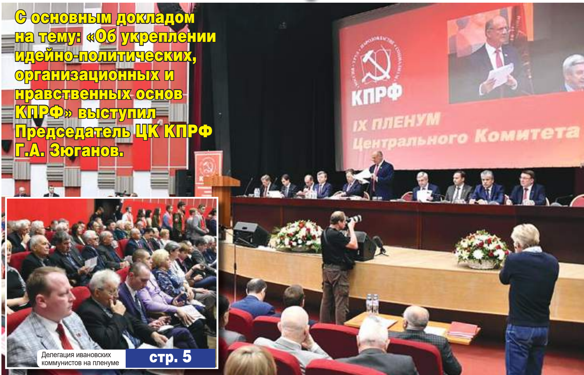
Делегация ивановских коммунистов на пленуме

С основным докладом на тему: «Об укреплении идейно-политических, организационных и нравственных основ КПРФ» выступил Председатель ЦК КПРФ Г.А. Зюганов.