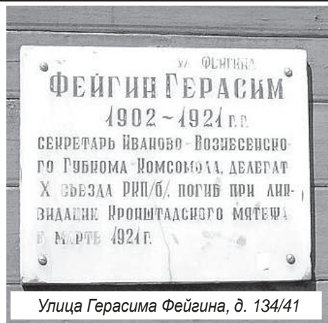
Улица Герасима Фейгина, д. 134/41

В Иваново «тихим сапом» убираются с глаз мемориальные доски (или как их сейчас принято называть – памятные таблички). Мы уже писали об изувеченной вандалами мемориальной доске М.Ф. Фрунзе на улице Степанова. Сохранились фото еще нескольких памятных досок, которых уже нет.