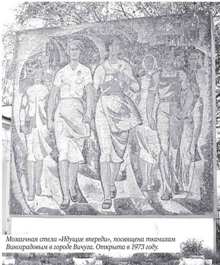
Мозаичная стела «Идущие впереди», посвящена ткачихам Виноградовым в городе Вичуга. Открыта в 1973 году.

изошел знаменательный диалог соперниц. «Одинцова: Заверяю вас, товарищи, что, соревнуясь с Дусей Виноградовой, я надеюсь, что план перевыполню и оставлю ее позади себя. Виноградова: Ты на сколько перейдешь? Одинцова: На 156 станков. Виноградова: А мы на 208 (из стенограммы Всесоюзного совещания стахановцев)».